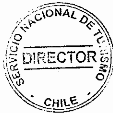
NICOLÁS MENA LETELIER Director Nacional (PT) Servicio Nacional de Turismo