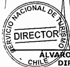
ÁLVARO CASTILLA FERNÁNDEZ DIRECTOR NACIONAL SERVICIO NACIONAL DE TURISMO